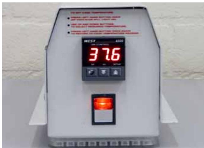
Op de verwarmingsunit is de temperatuur digitaal in te stellen.

Stel de Thermacage® vooraf in op 37,5 °C en laat het apparaat ongeveer tien minuten op temperatuur komen. Bij deze temperatuur blijft de stuwings van de bloedvaten in de staart van de muis goed en worden de bloedvaten goed zichtbaar.