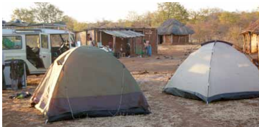
Afbeelding 2. Mukiwas in de achtertuin.