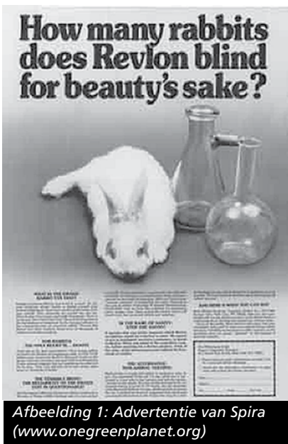
Afbeelding 1: Advertentie van Spira ( www.onegreenplanet.org )