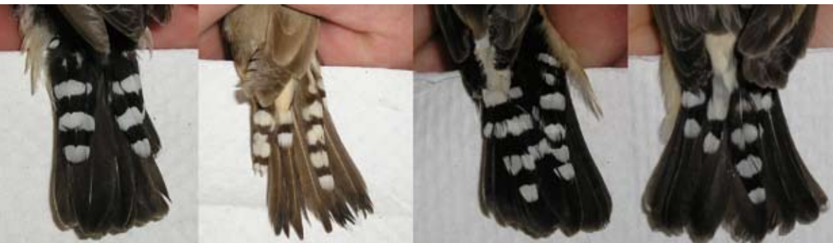
Afbeelding 2. Staarten van vier volwassen mannelijke zebrafincken.