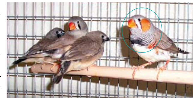
Afbeelding 1. Een familie zebravinken, aan de rechterkant zit het mannetje. Links zit een volwassen vrouwtje (midden) met aan beide kanten een jonge zebravink.

Ik geef toe dat ik nog nooit stil gestaan heb bij deze vraag, maar dat komt waarschijnlijk doordat ik nooit echt naar een zebravinkstaart kijk. Ik bestudeer herenen en gedrag, en ik zie dan ook voornamelijk de buikzijde/voorkant van een zebravink. Mijn nieuwsgierigheid was geboren en toen ik een aantal van mijn studenten vertelde over het 'strepren'-verhaal dat ik ging schrijven waren ook zij erg geïnteresseerd in de gestreepte staart. We togen met zijn vieren naar de diervverblijven en als het aan mijn studenten had gelegen, dan hadden we van alle 35 volwassen mannetjes de staarten gefotografeerd. We hebben ons beperkt tot vier staarten, en het zijn prachtige staarten, die er allemaal net iets anders uitzien (Afb. 2). Om een echt wetenschappelijk bewijs te leveren, denk ik dat mijn studenten niet alleen alle staarten dienen te fotograferen, maar ook de leeftijd van de vink in acht moeten nemen, de staartlengte, het lichaamsgewicht en wellicht ook het type huisvesting.