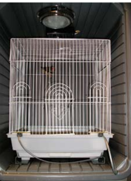
Afbeelding 3. Een close-up van een zang- en gedragsopname kooi. De zebrafinck is solitair gehuisvest in een kooi. Het zangpatroon, bewegingspatroon, eet- en drinkgedrag wordt automatisch geregistreerd.

Toen dat gebeurde, vond ik het welletjes en ik begreep dat ik iemand moest vinden die het manuele tellen voor ons kan automatiseren. Daar we niet de juiste persoon voor deze applicatie tot onze beschikking hadden op mijn afdeling, ben ik naar de Computer Science afdeling gestapt, en ik heb een student gevonden die voor ons een automatiseringsprogramma ontwikkeld heeft zodat we zanggebeurtenissen niet meer met de hand hoeven te tellen. Dezelfde student heeft ook een automatiseringsprogramma geschreven voor de locomotie en water- en drinkgedrag zodat we ook deze parameters niet meer met de hand dienen te evalueren. Door video-opnames van diverse dieren onder verschillen-