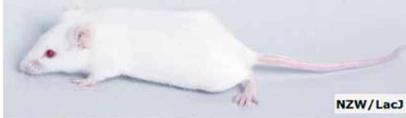
Afbeelding 3. Een 'New Zealand white'-inteeltmuis (boven), inteeltkonijn (linksonder) en outbred-konijn (rechtsonder).