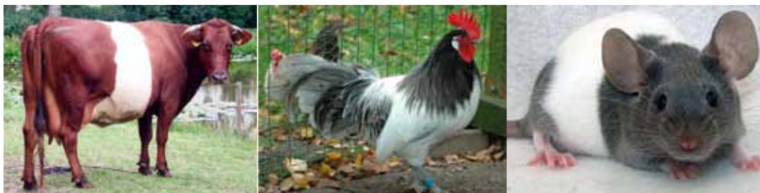
Afbeelding 6. Lakenvelder koe, haan en muis.

Een co-isogene stam (lijn) wordt weergegeven met de volledige naam van de stam waarmee de lijn co-isogene is. Dit wordt gevolgd door een liggend streepje. Vervolgens komt er ( cursief ) het gen-symbool met daarbij het gemuteerde allel in superscript , althans als de allelische variant ontstaan is door een spontane mutatie of chemisch-geïnduceerde mutatie. Bijvoorbeeld de C57BL/6J- Tyr c-2J co-isogene lijn; het betreft hier een spontane mutatie van de tyrosinase (= albino) locus in de C57BL/6J-inteelstam. De mutatie heeft als gevolg dat in haren en ogen het pigment ontbreekt. Ofwel het is een C57BL/6J-lijn die albino is.