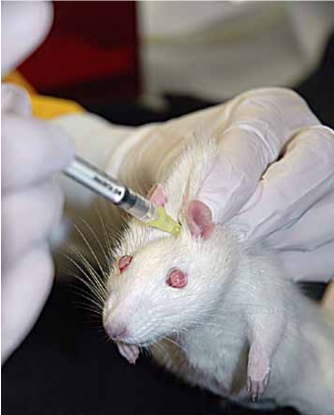
Afbeelding 4: Subcutane injectie levende rat.