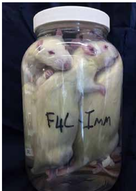
Afbeelding 1: Gebalseemde surplus ratten in de Fix-for-Life balsemvloeistof.

Vier keer per jaar wordt de FELASA geaccrediteerde proefdierkundecursus op het Leids Universitair Medisch Centrum (LUMC) gegeven. Onderdeel van deze cursus is het practicum muis en rat. Tijdens dit practicum leren wij de cursisten onder andere een aantal injectietechnieken en biotechnische handelingen. Uit een studentenevaluatie van één van deze cursussen kwam naar voren dat de meeste cursisten niet eerder een dier geïnjecteerd hebben en het mentaal en fysiek ook erg lastig vinden om dit gelijk op een levend dier te moeten doen. Met deze feedback zijn we al brainstormend op zoek gegaan naar hoe we deze drempel weg konden nemen. Eén van de alternatieven die we al gebruikten was het leren hechten op een fietsband. Dit is een prima alternatief voor het leren hechten, maar niet zo geschikt voor het leren injecteren door de huid van een muis of rat. We hebben verschillende voorwerpen verzameld waarvan we dachten dat er goed op geïnjecteerd kon