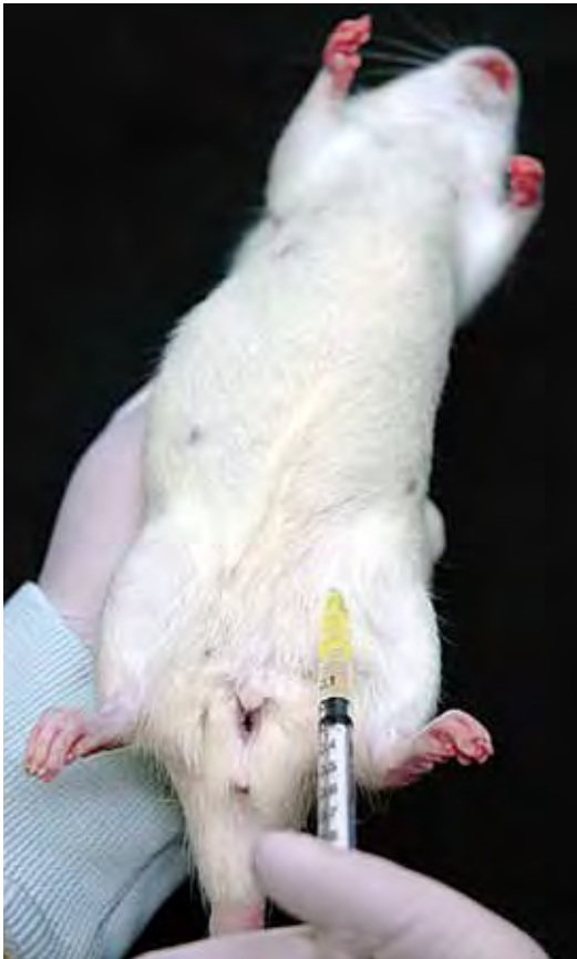
Afbeelding 7: Intraperitoneale injectie gebalsemde rat.