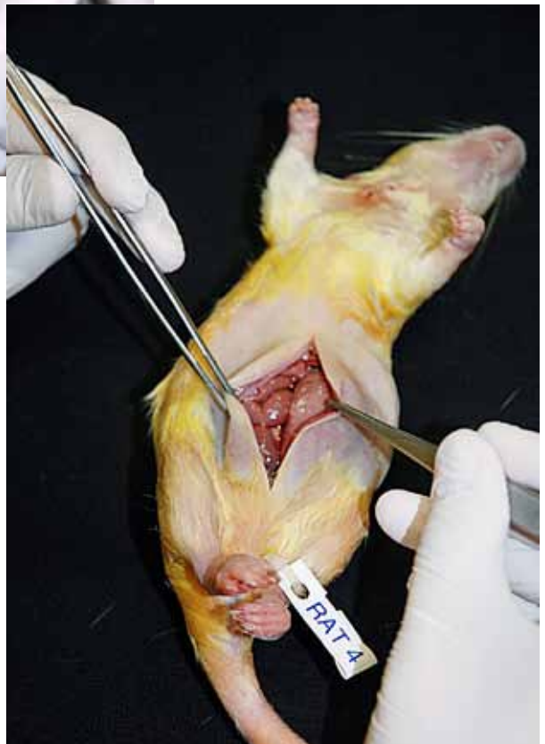
Afbeelding 9: Abdomen gebalseemde rat.