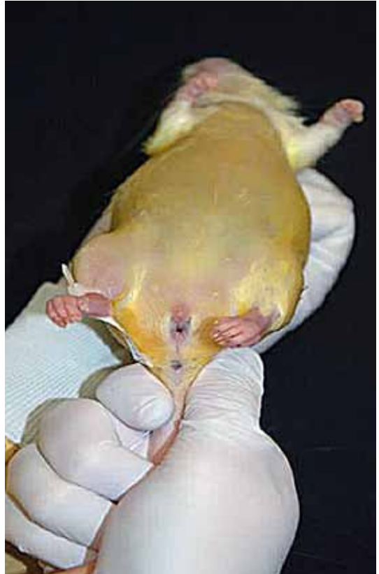
Afbeelding 3: Gefixeerde gebalsemde rat.

worden, zoals: appels, bananen en sinaasappels. Ook hebben we drie met Fix-for-Life (4FL) gebalsemde ratten geleend van de afdeling Anatomie en Embryologie van het LUMC. De afdeling Anatomie en Embryologie had deze ratten gebalsemd om de F4L balsemvloeistof en de methode uit te testen, vóór dit bij aan de wetenschap ter beschikking gestelde menselijke lichamen te gebruiken. Vervolgens hebben we een groep studenten van het Hoger Laboratorium Onderwijs (HLO) uitgenodigd die al enige ervaring hadden met het injecteren van dieren. Zij hebben alle voorwerpen en de gebalsemde ratten geïnjecteerd en kwamen tot de conclusie dat de F4L gebalsemde ratten en de bananen het meest natuurgetrouw voelden om te injecteren. Een groot nadeel bij het injecteren van de bananen is, dat wanneer de naald in een hoek van 90 graden wordt ingebracht het injecteren van de vloeistof erg lastig is vanwege de tegendruk.