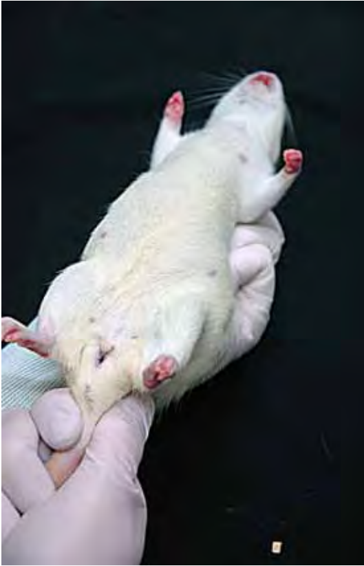
Afbeelding 2: Gefixeerde levende rat.