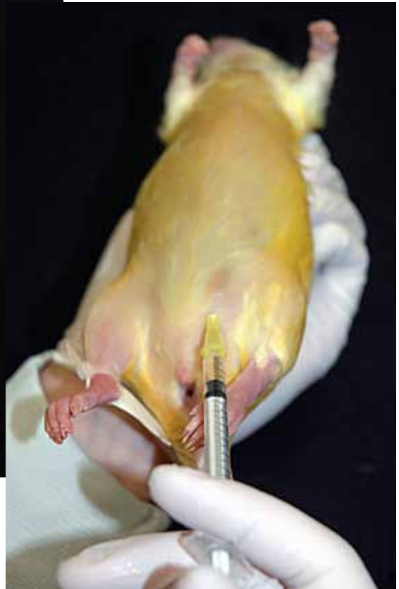
Afbeelding 6: Intraperitoneale injectie levende rat.