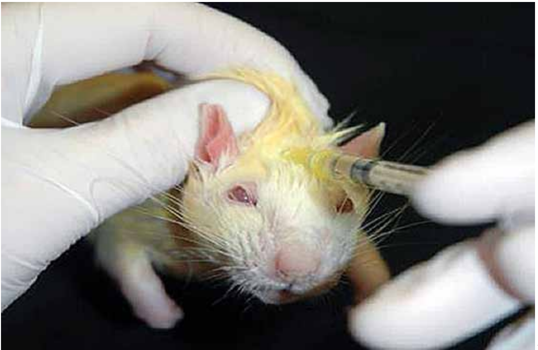
Afbeelding 5: Subcutane injectie gebalsemde rat.